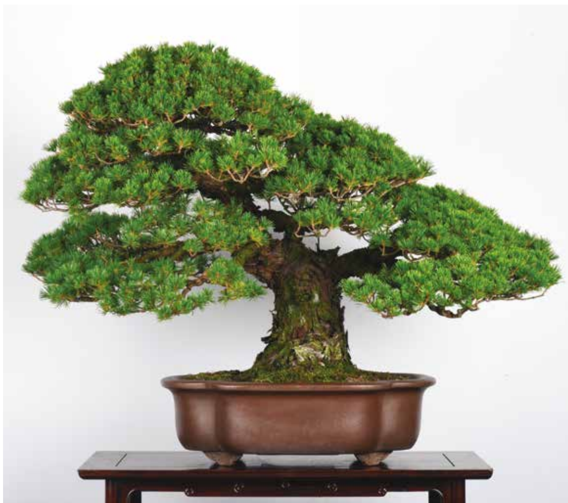
8. Pinus pentaphylla 'Zuisho', altezza 50 cm.