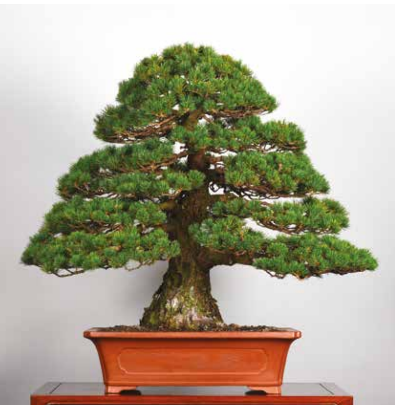
6. Pinus pentaphylla 'Zuisho', altezza 71 cm. È stato esposto da un membro del club di nazionalità americana.