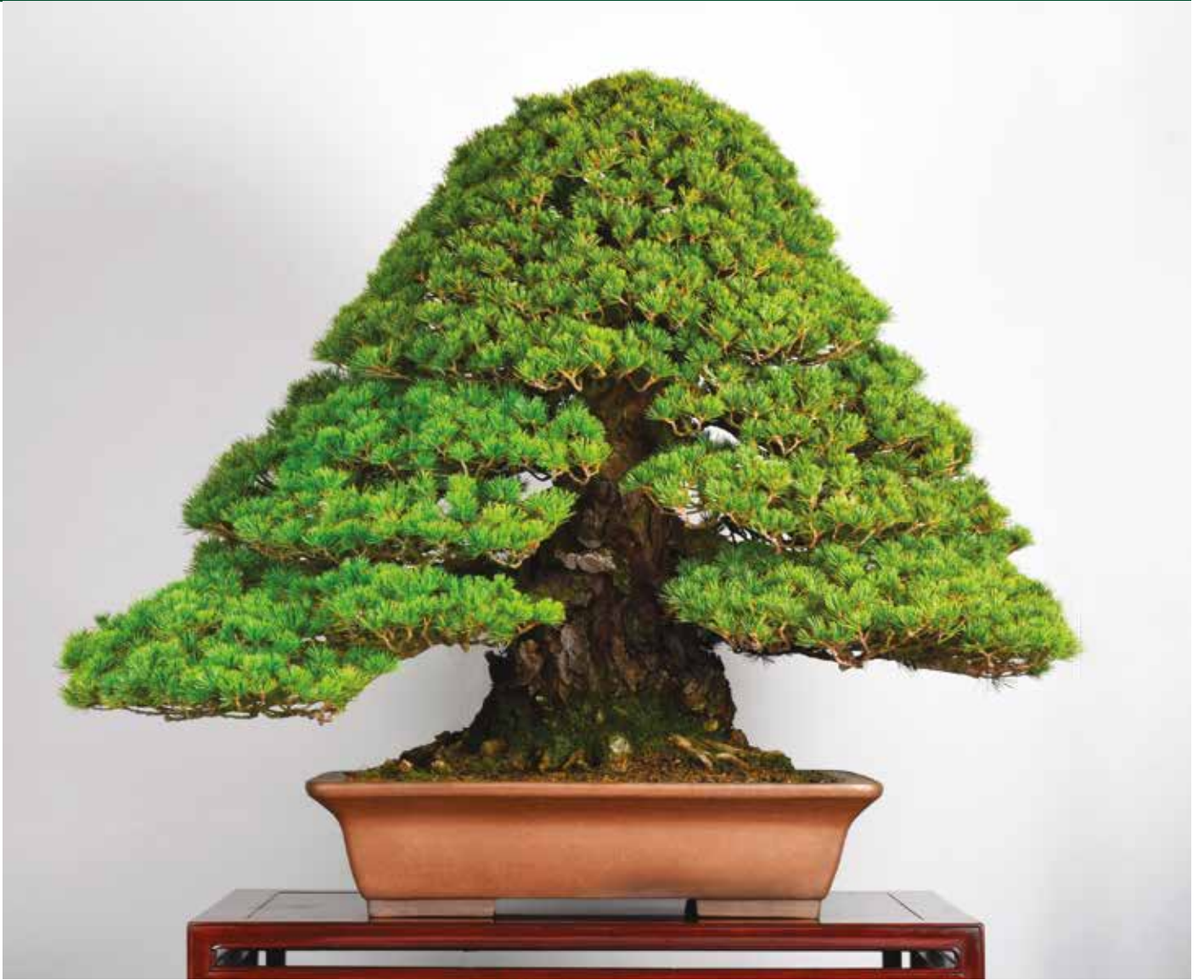
2. Pinus pentaphylla 'Zuisho', altezza 84 cm.