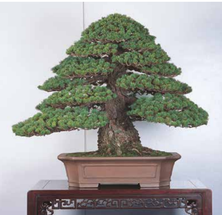
3. Pinus pentaphylla 'Zuisho', altezza 67 cm: lo stesso esemplare della foto sopra nel 2005.