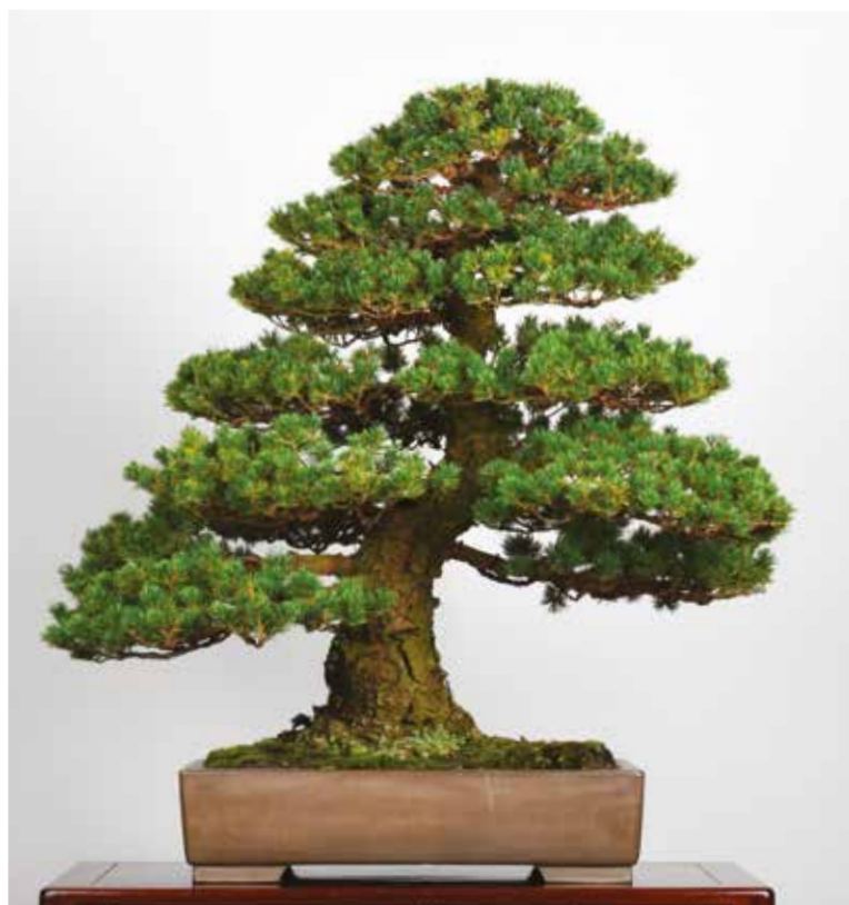
7. Pinus pentaphylla 'Zuisho', altezza 72 cm. Questo esemplare fu modellato diversi anni fa da Kimura durante una dimostrazione tenutasi in occasione di una precedente edizione dello Zuisho-ten.